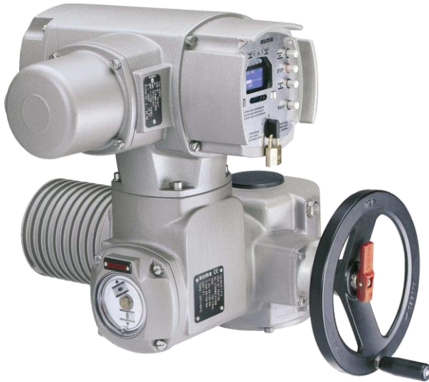
аума® Привод SA 1